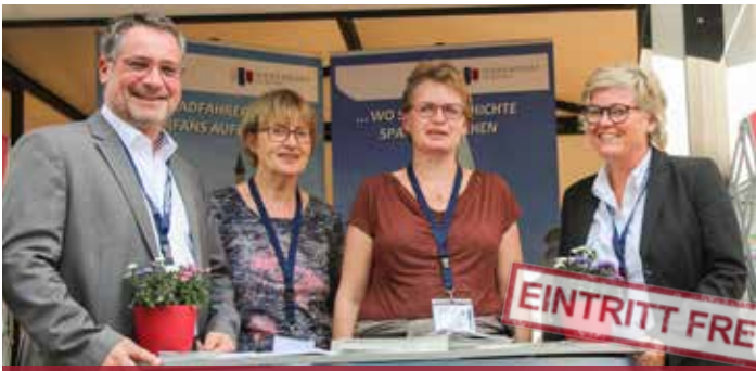
HANSEMARKT & BÜHNENPROGRAMM

17.00 Uhr Feierlicher Abschluss und Übergabe der Hansefahne an die Stadt Hattingen